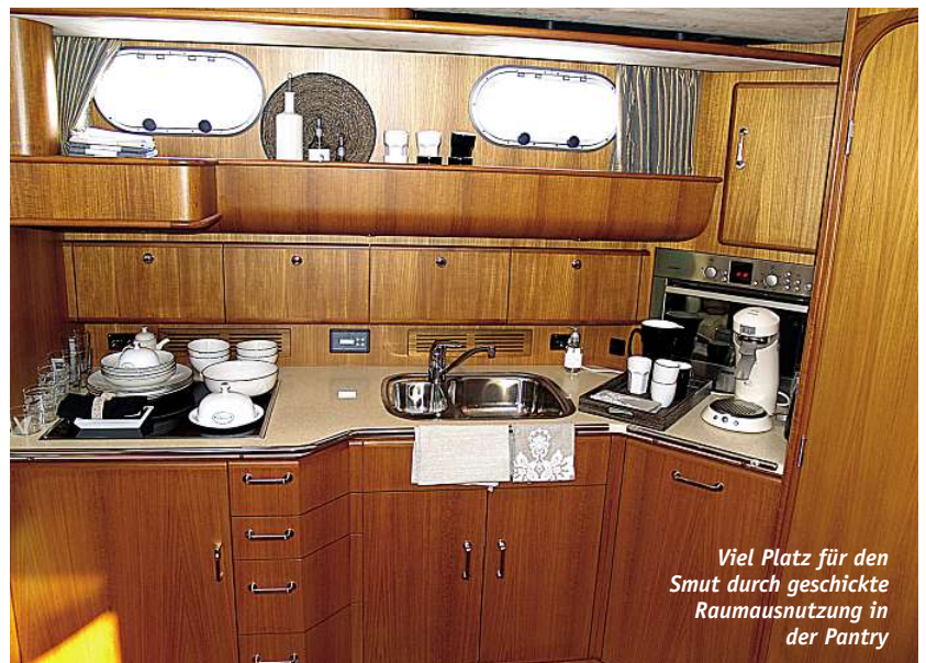
Viel Platz für den Smut durch geschickte Raumaussnutzung in der Pantry