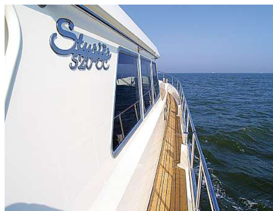
Das Teakdeck auf den Gangborden gehört zur Standardausstattung

Über fünf Tritte gelangt man in den Salon, wo an Backbord eine elegante Sitzgruppe mit ovalem Tisch geschaf-