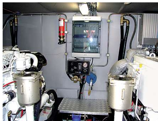
Professionell eingerichteter Maschinenraum mit viel Bewegungsfreiheit