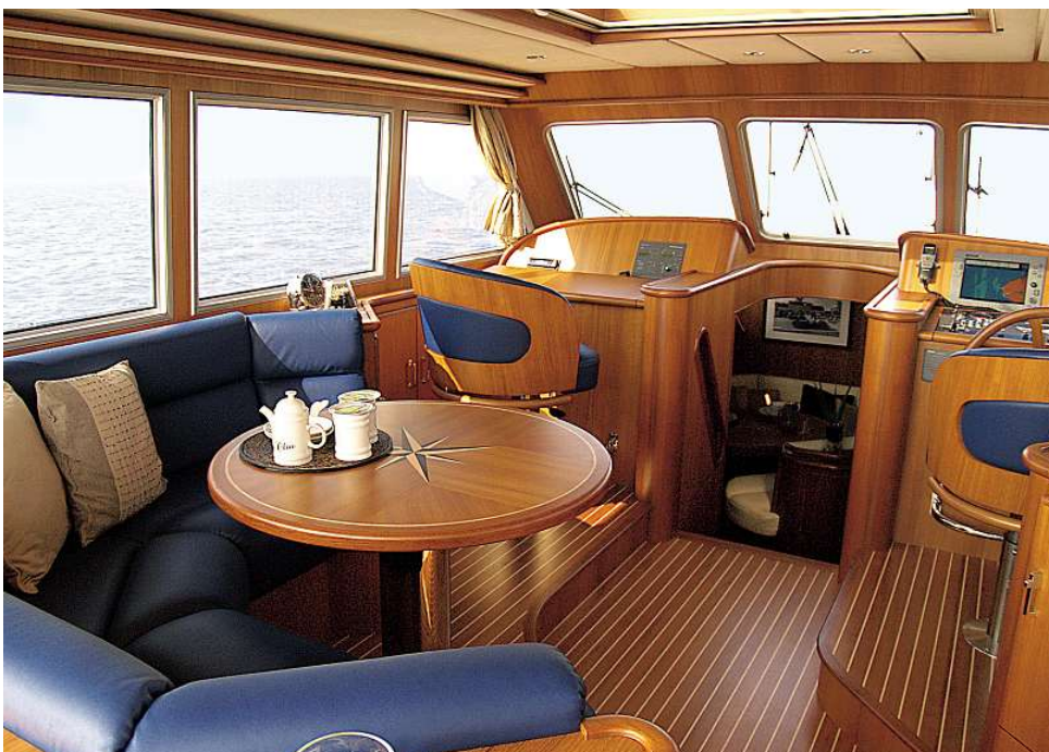
„Sozialstation“: Im geräumigen Ruderhaus ist Platz für die gesamte Crew