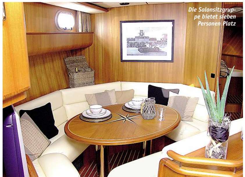
Die Salonsitzgruppe bietet sieben Personen Platz

Der Vorschiffsbereich ist der Eigenkabinen vorbehalten. Das Doppelbett misst 2,05 x 1,70 m. Als Mobiliar hat man einen großen Kleiderschrank und vier Kommoden einge-