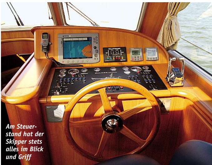
Am Steuerstand hat der Skipper stets alles im Blick und Griff