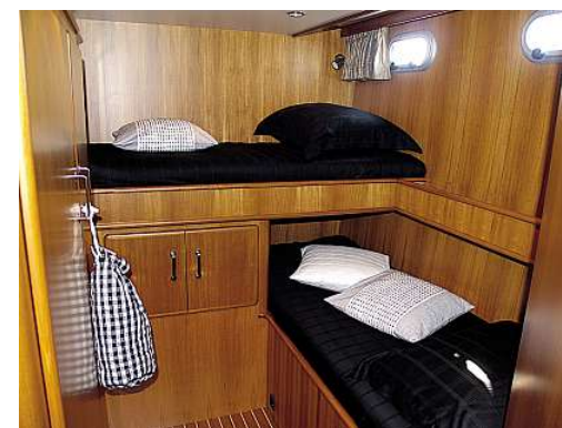
Über Eck gebaute Kojen in der Gästekabine